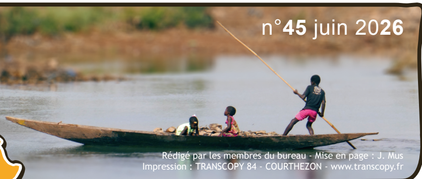
Rédigé par les membres du bureau - Mise en page : J. Mus Impression : TRANSCOPY 84 - COURTHEZON - www.transcopy.fr

Léo, association au profit des Orphelins Handicapés du Mali Créée en 1999 - Loi 1901 - Déclarée à Avignon - siret : 519 212 096 00019