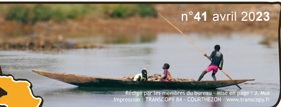
Rédigé par les membres du bureau - Mise en page : J. Mus Impression : TRANSCOPY 84 - COURTHEZON - www.transcopy.fr

Léo, association au profit des Orphelins Handicapés du Mali Créée en 1999 - Loi 1901 - Déclarée à Avignon - siret : 519 212 096 00019 www.leo.asso.fr - contact@leo.asso.fr - : Association LEO